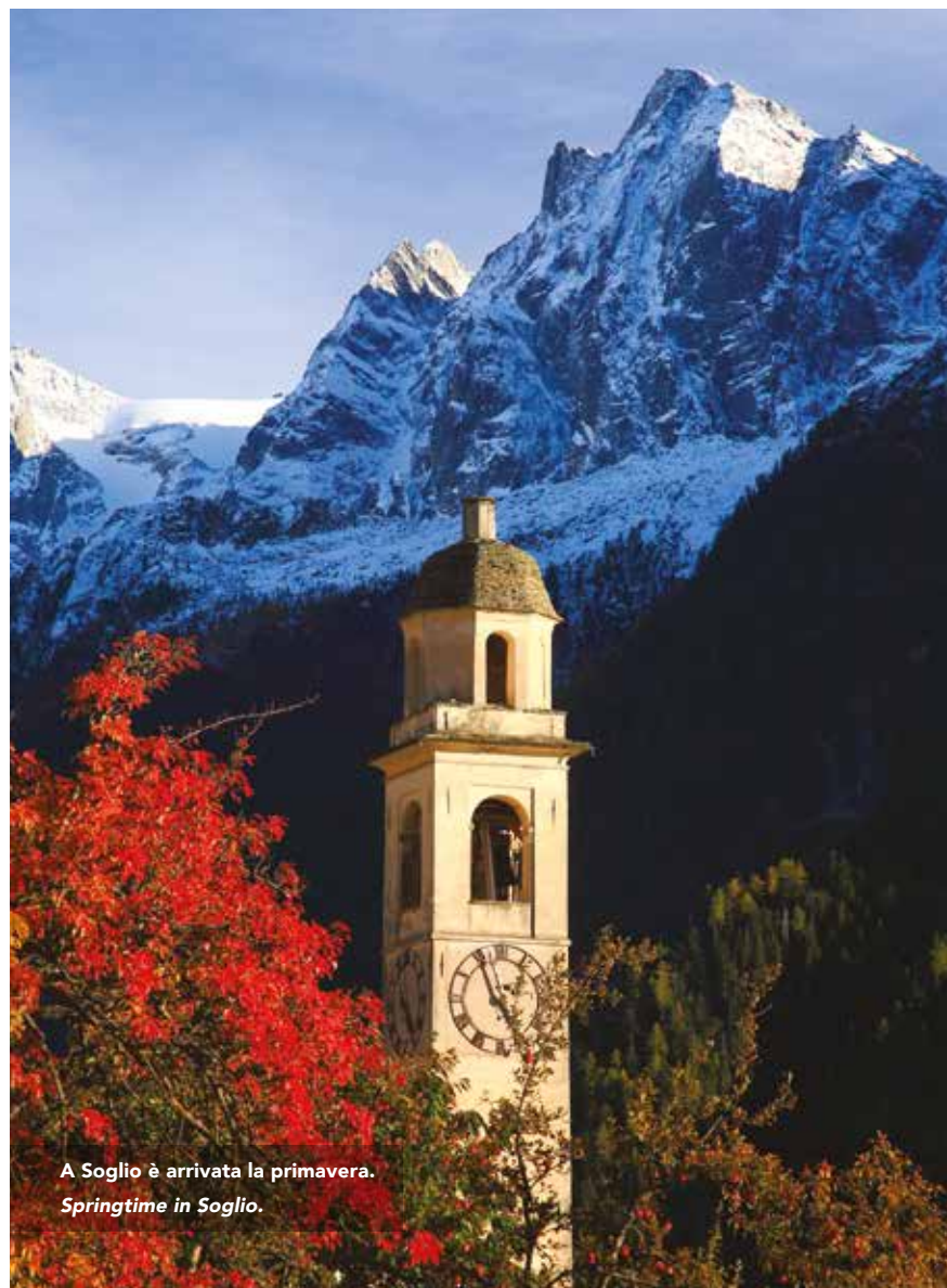
A Soglio è arrivata la primavera. Springtime in Soglio.

The tèngar suggest not to leave the village before tasting the local products such as the excellent cow and goat cheese, the traditional dried meat from Grisons region or the chestnut cake.