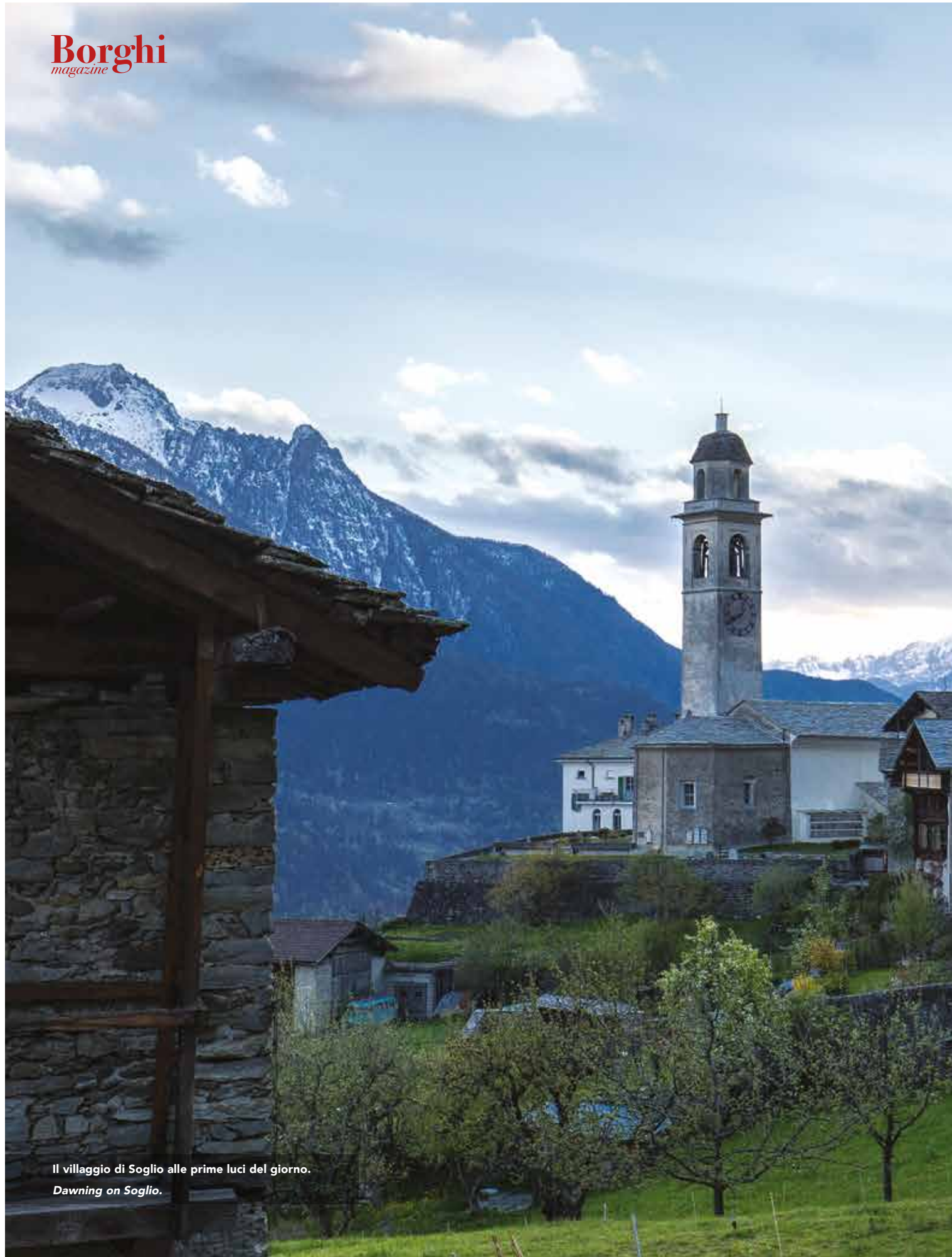
Il villaggio di Soglio alle prime luci del giorno. Dawning on Soglio.