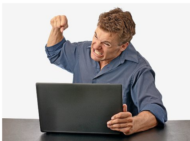
Anno 2020: la frustrazione dilaga sul web. DEPOSIT

La notizia di un possibile vaccino anti Covid ha generato una valanga di commenti irripetibili, un po' ovunque. «Mediaticamente si è visto di tutto in questi mesi. Anche me-