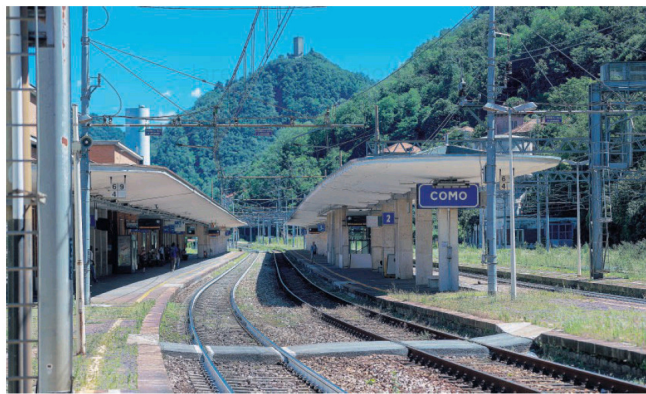
La stazione di Como

Ombre anche sul progetto di elettrificazione?