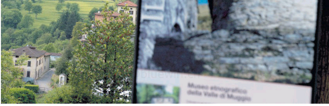
Il territorio, un patrimonio da valorizzare