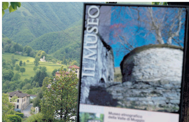
Il territorio, un patrimonio da valorizzare